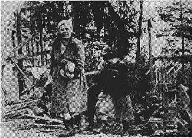
Reipasta talkooväkeä Kansantalon työmaalla viisikymmenluvun alussa.

edelleenkin vuosittain Kansantalon kunnossapitoon ja toiminnan järjestykseen.