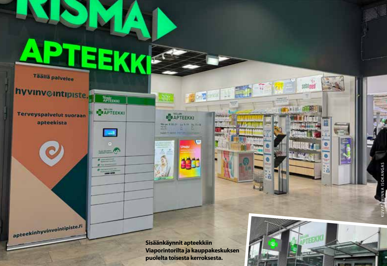
Sisäänkäynnit apteekkiin Viaporintorilta ja kauppakeskuksen puolelta toisesta kerroksesta.