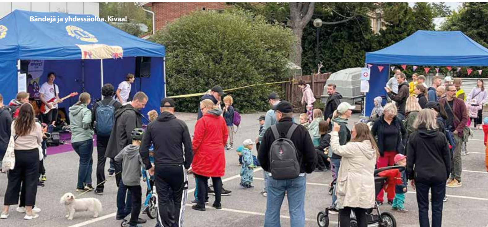
Bändejä ja yhdessäoloa. Kiva!

Lastenmusiikki-orkesteri Funky Monkey viihdytti pienimpiä juhluvieraita.