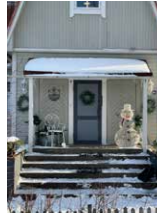
Syksyn 2023 Lintusen kanteen talvitunnelmaa Hippiäisentieltä kuvasi Minna Isokangas.