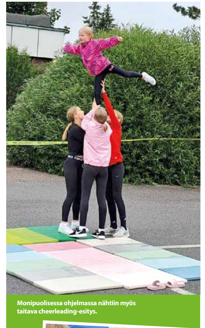
Monipuolisessa ohjelmassa nähtiin myös taitava cheerleading-esitys.

Lintuvaara-päivän tapahtuma on hieno esimerkki siitä, miten yhteisöllisyys ja vapaaehtoistyö voivat luoda positiivista energiaa ja yhdistää ihmisiä erilaisissa ikäryhmissä. Tulevaisuudessa tapahtuman järjestäjät odottavat innolla, mitä uusia ja innostavia ideoita seuraava tapahtuma tuo tullessaan. •